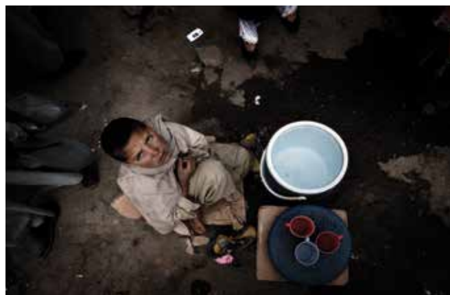
In attesa della goccia.

Secondo Adam Smith (seconda metà '700) e John Stuart Mill ('800), il capitalismo 1 esprimeva appieno il senso di progresso la cui fragranza andava diffondendosi nel mondo con la prima industrializzazione del lavoro. Quel profumo avrebbe comportato la distribuzione della ricchezza e la riduzione delle ore di lavoro, elevando così la condizione della popolazione del pianeta. Avrebbe tolto l'uomo dal fango, dalla fame, dal freddo, dalla miseria, regalandogli invece una vita leggera colma di accessori e di tempo libero. Dall'alambicco dell'economia capitalista sarebbero cadute gocce di benessere.