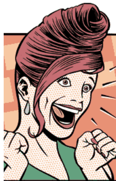
Saldi. L'attesa è finita.

«...un integralismo economico che non è congiunturale, perché capace di operare una reductio ad unum.» 8