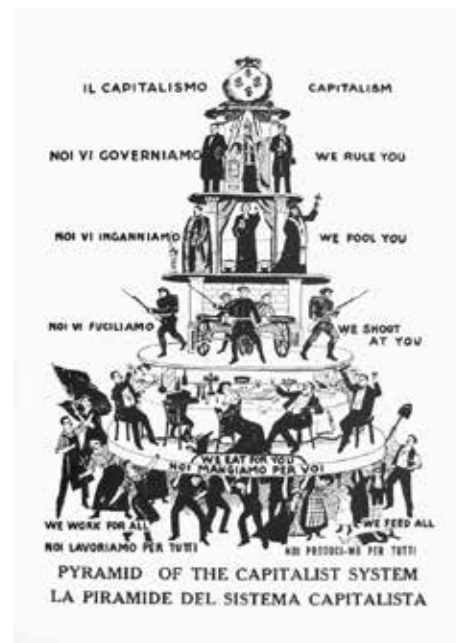
La piramide che non tutti vedono.

E siamo a ieri. La guerra era finita, la nazione si era formata, l'italiano aveva sostituito e spesso anche re-so negletti i dialetti. La scienza era ora identificata da tutto un popolo – non solo in Italia – come un valore indiscutibile, come verità accertata e certa. La lunga manu dei positivisti aveva colpito il lato destro del cervello.