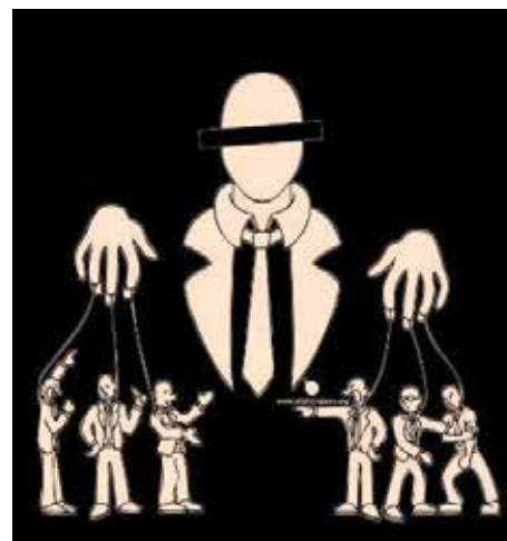
Convinti di professare l'inalienabile diritto del libero arbitrio, corriamo felici al centro commerciale.

Il passato è finito. Sul futuro si può dire tutto. Ci si può chiedere se è auspicabile un capitalismo organizzato da regole mirate alla distribuzione della ricchezza. Garanzie di equità e libertà sono compatibili con il sistema capitalistico finanziario? In caso positivo, si potrebbe condividere che, è vero che la miglior società e cultura è quella a sua immagine e somiglianza. In caso negativo? Non tutti condividono la prospettiva descritta sul piano