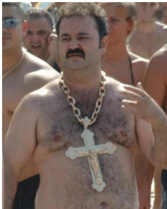
Il dogma e l'abisso, amici d'infanzia.

Se è vero che la storia procede a balzi rivoluzionari, tutti caratterizzati da un nuovo che si fa spazio nel vecchio, si può condividere che l'epoca dei lumi affermava modalità di conoscenza e interpretazione della realtà appunto nuove rispetto all'epoca precedente. La nuova nomenclatura dello scibile, tanto fisico che metafisico, ha soddisfatto in lungo e in largo gli spiriti del tempo. La nuova moda, come il fuoco nella sterpaglia, si è estesa ovunque e velocemente. Ha preso tutti gli ambiti dello scibile. Ha ghettizzato e ridicolizzato le dimensioni più umane, quelle dove era ed è impotente. È riuscita a divenire cultura egemone e contemporaneamente a lasciare sul piatto del vero e del giusto, solo le parti che ritiene di essere riuscita a comprimere entro le sue artificiose, autoreferenziali categorie. Ha prodotto gli specialisti e ci ha indotto a credere in loro. Ora la loro parola conta più del nostro sentire. Forse qualcosa non va.