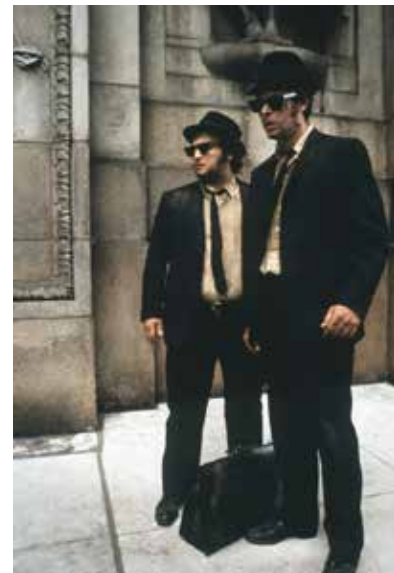
"Fate gesti, abbiate pensieri, vivete sentimenti di deliberata bellezza."

Ovvero, restando soddisfatti del livello intellettuale non si cambia nulla , al massimo di fa moda. Con la seconda consapevolezza non c'è niente da cambiare perché si è già cambiato tutto. Per-mutare dalla prima alla seconda serve un pieno di umiltà, un cambio di abitudini. È qui il percorso nel quale immergersi. Così l'egoica pretesa di affermazione del verbo e l'emozione del vanto dialettico possono cessare, lasciando il campo all'amore.