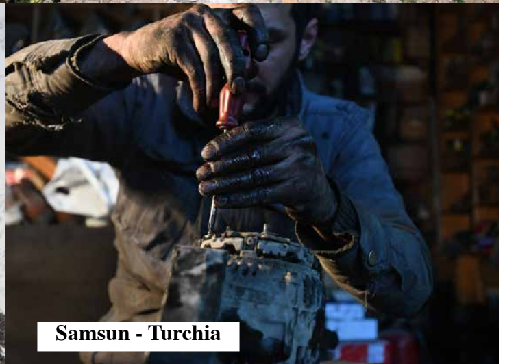
Samsun - Turchia