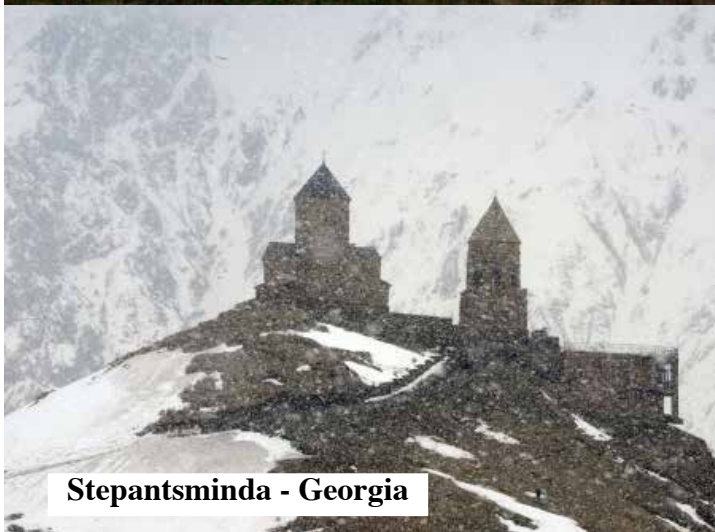
Stepantsminda - Georgia