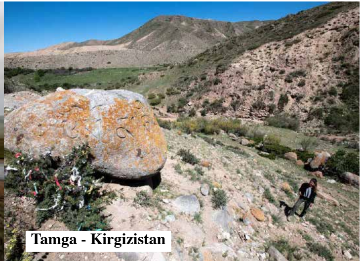
Tamga - Kirgizistan