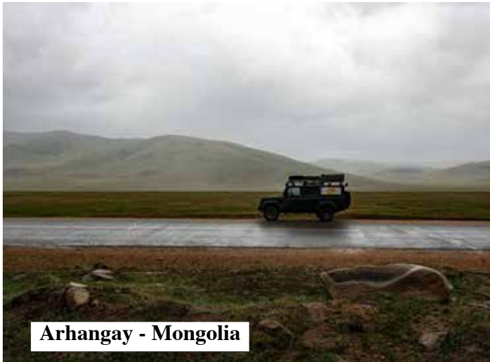
Arhangay - Mongolia